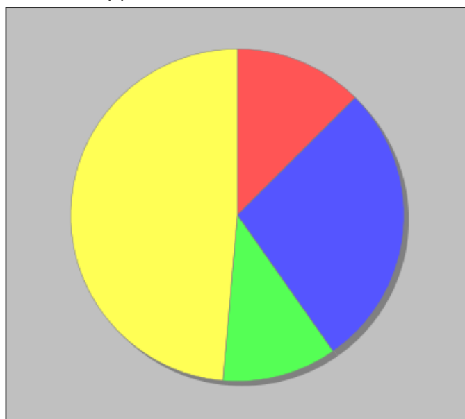
Distribuzione dei docenti a T.I. per anzianità nel ruolo di appartenenza (riferita all'ultimo ruolo)