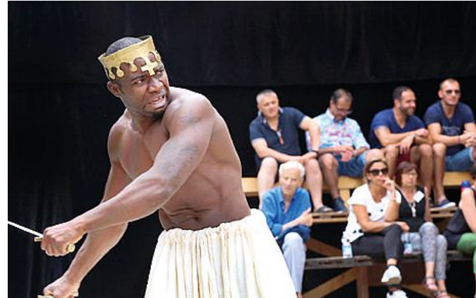
Una scena dello spettacolo della Compagnia della Fortezza

Oggi InArea - La Cabala - dalle ore 21 nel borgo di Lari serata conclusiva del Collinarea Festival 2016.